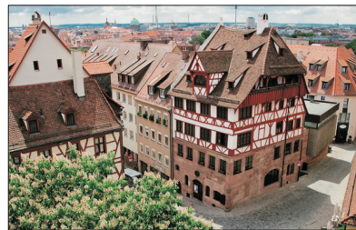
「中世紀風情」 紐倫堡

乘坐登山火車或纜車登上全德國最高約一萬尺高之楚格峰，更可於觀景台飽覽一望無際雪山景。