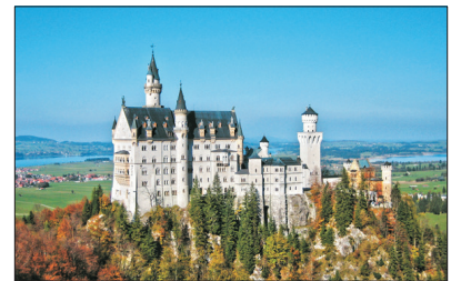
「童話世界靈感來源」 新天鵝堡

「古堡之路」其中一站，參觀紐倫堡市內名勝，小山崗上的皇帝堡還保留有五公里城牆，市堡廣場、古噴泉與聖母院教堂，配搭成攝入美麗的畫面。德國最古色古香的老城市，其中保留了一座中世紀的城牆圍繞著整個紐倫堡，也紀錄著它的歷史遺跡。