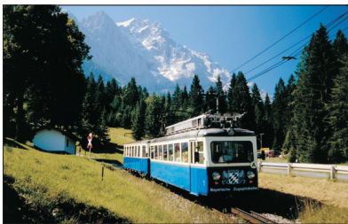
「高峰美景」 楚格峰大雪山

乘坐登山火車或纜車登上全德國最高約一萬尺高之楚格峰，更可於觀景台飽覽一望無際雪山景。