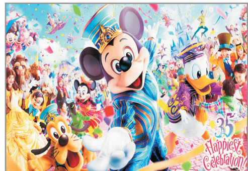
東京迪士尼35周年慶