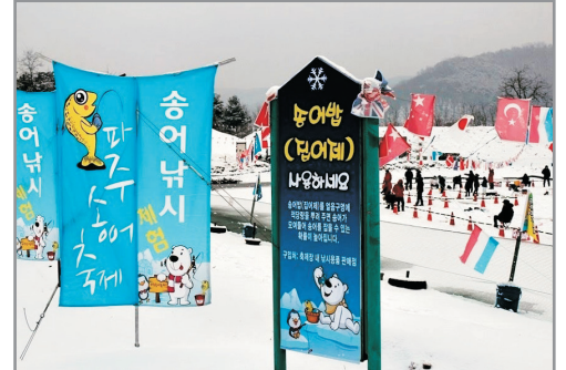
《增遊》坡州鱒魚冰釣祝祭 (1月1日至31日出發團隊適用)