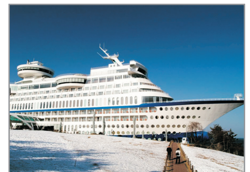
【獨家】Sun Cruise Hotel & Condo