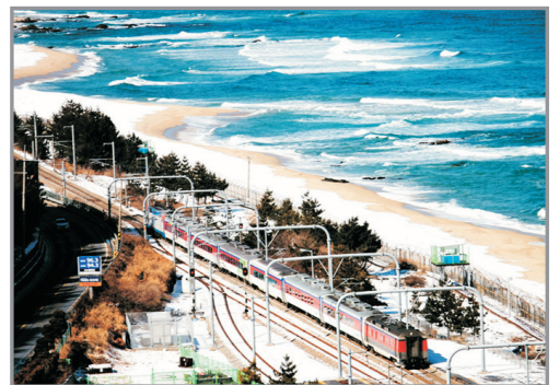
正東津臨海火車體驗