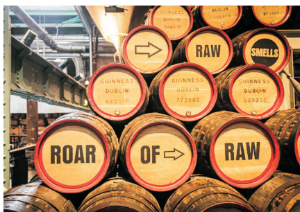
健力士黑啤釀酒廠