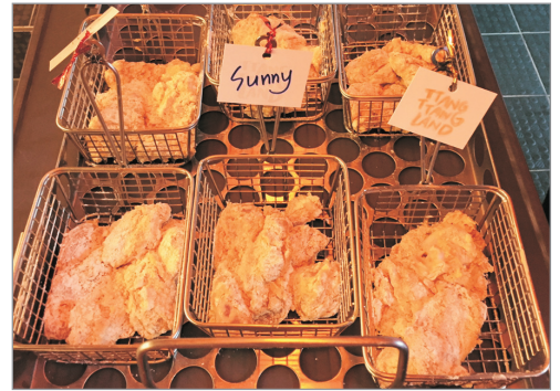
TTANG TTANG Land炸雞DIY體驗