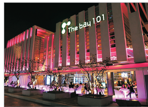
The Bay 101藝術廊