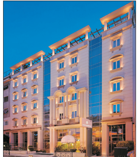
Stratos Vassilikos Airotel酒店(雅典)

~ 布拉卡區 ：布拉卡區(PLAKA)是繼衛城之後，雅典另一必遊景區，這個古老區域位於憲法廣場、衛城及阿果拉組成之三角地帶，是雅典遊人最多的區域。在瀟灑十九世紀氣氛的街道上，佈滿各式各樣的手工藝品店，售賣著區內獨有的希臘土產。希臘人喜歡穿金戴銀，手製金銀飾物亦是當地著名工藝，所以Plaka街上首飾店林立，飾物款式通常圍繞希臘神話。此外還有眾多地道希臘餐廳及咖啡店，間中更可見到一些拜占庭式的東正教堂。 * 如遇高速噴射船客滿或船期更改或因天氣情況之影響下，將改乘渡輪前往，敬請留意。