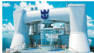
Ripcord by iFly海上跳傘體驗®*