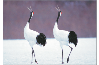
釧路濕原國立公園