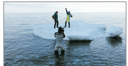
流冰Walk 流冰不單只用眼睇， 仲可以直接企上去又或者成個人躺上去添!!