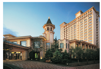
成都雅居樂豪生大酒店