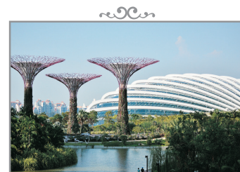
Gardens by the Bay~ Flower Dome & Cloud Forest Dome