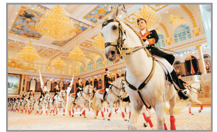
盛裝舞步馬術表演(12月29日出發團隊適用)