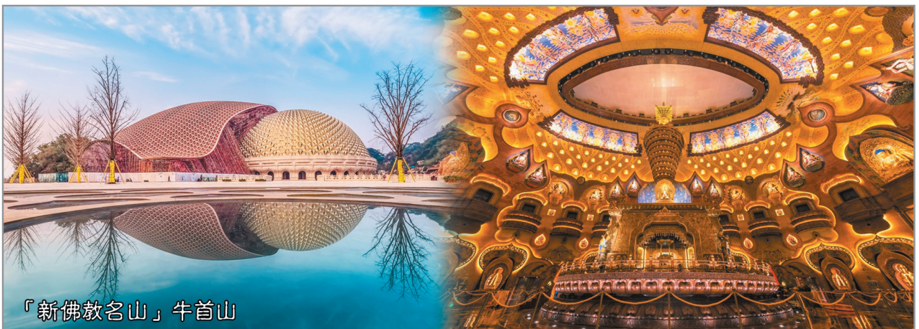
「新佛教名山」牛首山

牛首山佛頂聖境耗資70億打造，其中之佛頂宮建築莊嚴祥和，不論外牆、門檻抑或天花均滿佈雕刻，設計巧奪天工。佛頂宮內建有一座臥佛，其造型借鑑於敦煌莫高窟中的臥佛塑像，面容莊嚴而慈祥，並會360度緩慢地旋轉，寓意佛法恩澤四方。而位於地下五層深之千佛舍利地宮，由宮外長廊至宮內均金碧輝煌，華麗非凡。