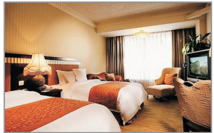
成都世紀城假日酒店