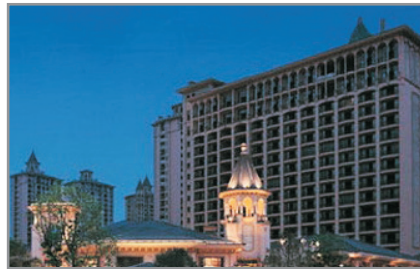
成都雅居樂豪生大酒店