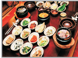
景福宮正宗韓國料理+烤肉