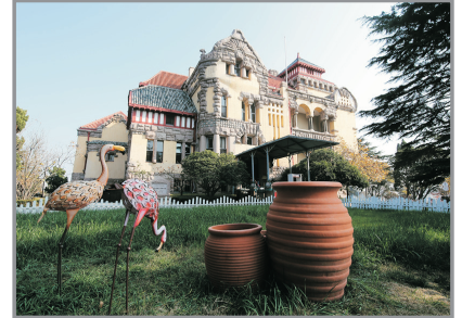
青島德國總督府(迎賓館)

~八大關: 由花園與別墅結合的八大關風景區, 因區內有八條馬路均以長城著名 關口而命名, 這裡更因青島曾為德國殖民地, 而遺留不少異國風情的建築。