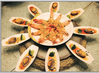
鮑魚對蝦豪華海鮮餐