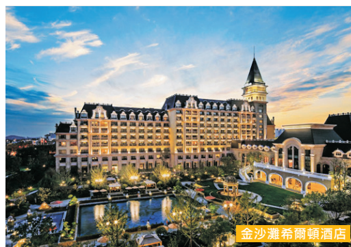
金沙灘希爾頓酒店

緊鄰青島最美沙灘之一的金沙灘，坐擁美麗的西海岸風景線，與老城區隔海相望。建築為德式古堡風格，極富古典歐陸風情。酒店設有430間時尚客房和套房，客房寬敞舒適，面積從42平方米起，並設觀景陽台，亦可透過落地式玻璃窗飽覽壯麗景觀。(網址： www.hilton.com.cn/zh-HK/hotel/Qingdao/hilton-Qingdao-TAOGBHI )