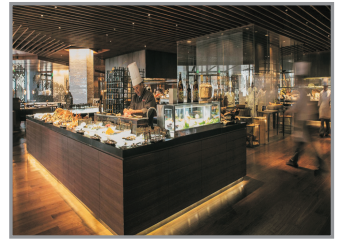
涵碧樓豪華自助晚餐