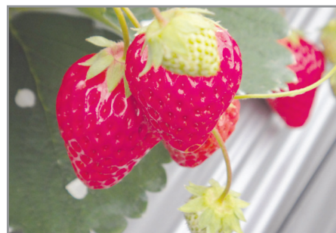
增遊時令果園任食士多啤梨