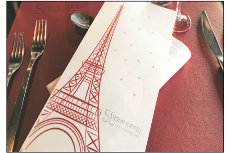
鐵塔餐廳內享用午餐