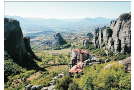
梅提歐拉(天空之城)