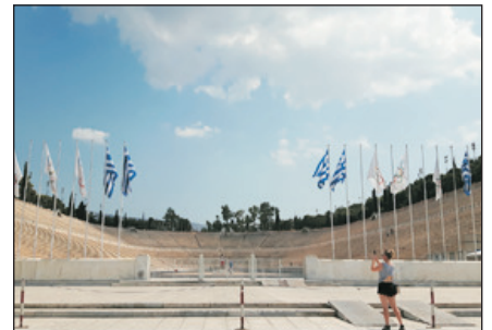
奧林匹克運動會場

~「巴特農神殿」：始建於西元前5世紀。當時雅典正迎向黃金時代的來臨，將軍兼政治家的佩利克雷斯著手重建整個雅典衛城。被譽為多里斯式建築最高傑作的巴特農神殿，是為祭祀雅典的守護神雅典娜女神，由多位建築師、雕刻家、技術人員監督而建，於西元前447年動工，直到西元前432年才完成。這座以白色大理石興建的神殿規模，寬約31米、深70米、柱高10米。屋頂最高點至地面的高度與建物寬度的比率，採1:1.618的黃金比率，為了呈現建物之美，採用高度的建築技巧。神殿正面和後側的山牆(屋頂下方的三角部份)，以及屋頂、山牆與柱間的牆面，都以神話故事或古代歷史為主題的雕刻裝飾。神殿內部可區分為4部分，由東門進入後，有玄關、神室、少女之室、後室。神室裡以菲迪亞斯傑作，以黃金和象牙製作，高12米的阿特娜·巴特農(意指處女)之像裝飾。