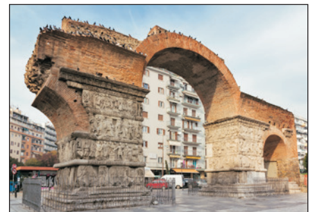
加萊里烏斯凱旋門