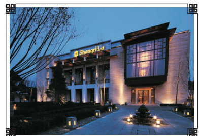
拉薩香格里拉大酒店