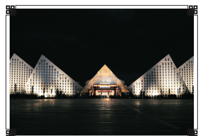
聖地天堂洲際大飯店