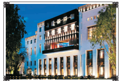
拉薩瑞吉度假酒店