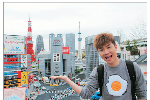
名古屋Legoland樂園(迷你樂園)