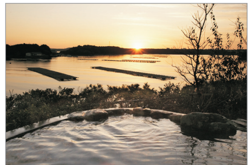
賢島寶生苑溫泉度假酒店