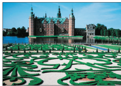
「北歐最美麗的城堡」費德烈城堡

乘坐觀光破冰船~Polar Explorer，體驗難能可貴的極地探索之旅。親眼目睹壯麗無比的冰海奇景，親身體驗破冰船碾碎冰層的震撼感覺。重頭節目是穿上特製全身防水保暖橡皮衣，躺在飄著浮冰的冰海中，安全好玩，體驗畢生難忘的旅程。