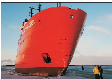
「難忘體驗」破冰船之旅

乘坐觀光破冰船~Polar Explorer，體驗難能可貴的極地探索之旅。親眼目睹壯麗無比的冰海奇景，親身體驗破冰船碾碎冰層的震撼感覺。重頭節目是穿上特製全身防水保暖橡皮衣，躺在飄著浮冰的冰海中，安全好玩，體驗畢生難忘的旅程。