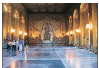
「華麗會場」 斯德哥爾摩市政廳 參觀黃金大廳及藍色大廳

探訪聖誕老人村，一睹傳說中聖誕老人的真面目，村內所有建築物都是充滿童話色彩的歐陸式木屋。團友可在北極圈分界線拍照留念，更可獲得一張到達北極的證書。村內的聖誕老人郵局亦是必遊之處，除了有多項設計精美的聖誕郵票及精品外，團友更可自費填表，便可以在聖誕節收到聖誕老人寄來的賀節信件。