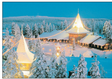
「親身到訪」聖誕老人村

乘坐觀光破冰船~Polar Explorer，體驗難能可貴的極地探索之旅。親眼目睹壯麗無比的冰海奇景，親身體驗破冰船碾碎冰層的震撼感覺。重頭節目是穿上特製全身防水保暖橡皮衣，躺在飄著浮冰的冰海中，安全好玩，體驗畢生難忘的旅程。