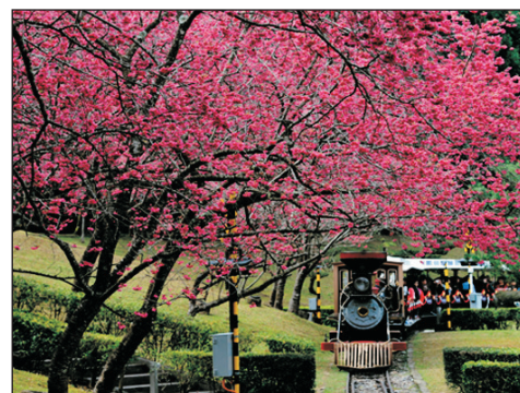
九族文化主題樂園