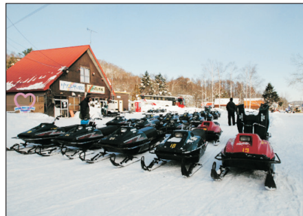
野外攀山雪車場(自費暢玩)

Day 5 野外攀山雪車場 #(自費項目:野外攀山雪車) (註3,4) 一札幌→香港 #團友可自費暢玩,單人車約¥10,000,雙人車約¥15,000-¥16,000(約1小時)。