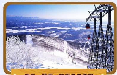
溫泉、滑雪，享受冬日樂趣

前往網走乘搭大型破冰船，近距離觀賞千變萬化的流冰，感受船底輾過流冰的震撼感覺，令人畢生難忘！除了令您嘆為觀止的壯麗流冰景觀外，更有機會看到躺在流冰上歇息的可愛海豹及空中翱翔的海鷗。破冰船上更設有咖啡室及商店，提供舒適的環境，讓您悠閒休息及暖和身體。(註3) (2019年1月20日-3月31日出發適用)