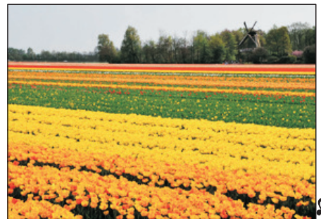
東西湖鬱金香公園