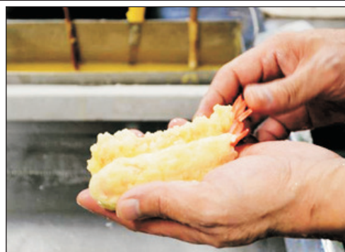
食品樣本工房體驗