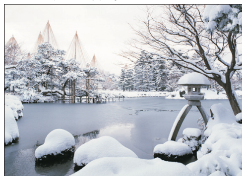
「日本三大名園」兼六園