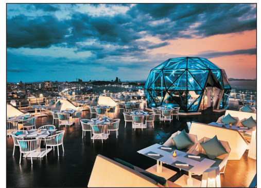
Grande Centre Point Pattaya