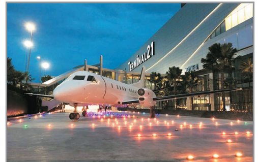
Grande Centre Point Pattaya

《保證入住豪華五星級Grande Centre Point Pattaya二晚》、 《獨家入住曼谷市中心豪華五星級Grande Centre Point~ Sukhumvit 55二晚》、芭堤雅Terminal 21購物商場、 水上樂園、百萬年石頭公園+鱷魚潭、曼谷火車夜市 《不設指定購物店、悠閒享受酒店設施》