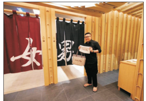
Grande Centre Point~Sukhumvit 55