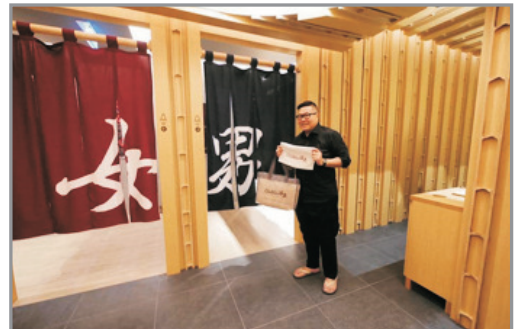
Grande Centre Point~ Sukhumvit 55