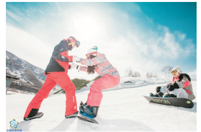
崇禮雲頂樂園滑雪場