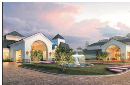
懷來皇冠假日酒店