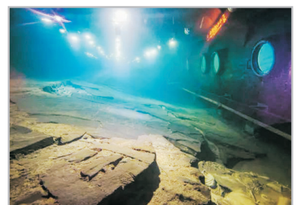
白鶴梁水下博物館

被譽為世界第一古代水文站、世界水文資料寶庫、水下碑林，是三峽文物景觀中唯一的全國重點文物，也是世上首座水下博物館。博物館位於水下四十米深，可以觀賞白鶴梁原址的石碑和題刻。