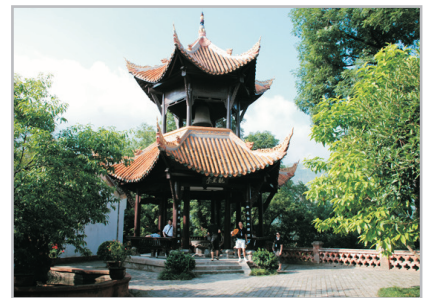
白帝城 (3月17日-24日及6月1日-9月1日出發團隊增遊)