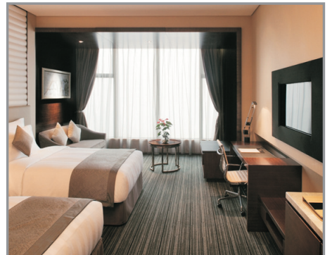
麗笙世嘉酒店房間