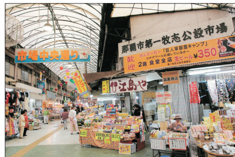
牧志公營市場(日本)