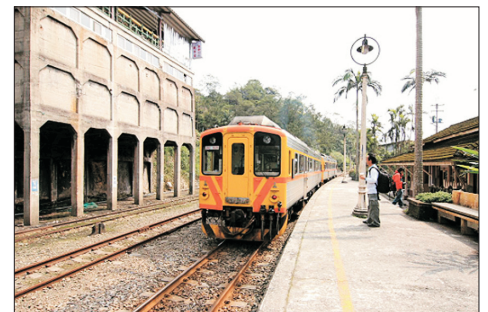
菁桐木造火車站(台灣)