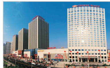
宜昌富力皇冠假日酒店