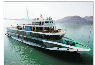
永安獨立包船遊覽