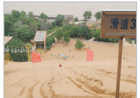
沙坡頭風景區(滑沙體驗)