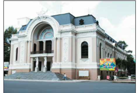
法國風情的市立歌劇院

胡志明市、古芝地道、戰爭博物館、湄公河三角洲、 熱帶水果園、耶穌山、鯨魚廟、濱城市場、天后廟