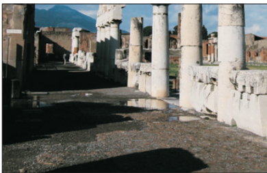
「火山塵封的古城」 龐貝古城