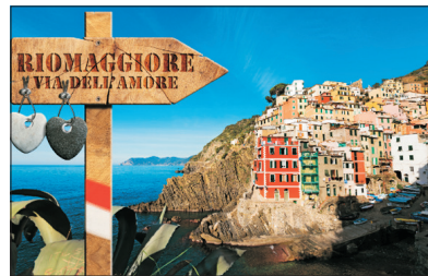
世界文化遺產~ 五漁村

位於意大利北部，由五個沿海岸線發展但各有特色的村莊組成，因古時對外交通不便、長期與世隔絕，維持著上千年傳統的生活方式，直到近年才開通火車，其浪漫景色和迷人的文化得以被發現。1997年，被聯合國教科文組織列為世界文化遺產名錄。近年已成為遊客訪意必遊的景點之一。