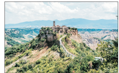
「天空之城」 白露里治奧

位於意大利北部，由五個沿海岸線發展但各有特色的村莊組成，因古時對外交通不便、長期與世隔絕，維持著上千年傳統的生活方式，直到近年才開通火車，其浪漫景色和迷人的文化得以被發現。1997年，被聯合國教科文組織列為世界文化遺產名錄。近年已成為遊客訪意必遊的景點之一。