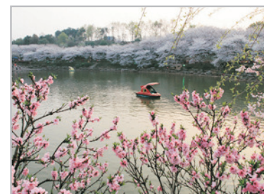
湖南省森林植物園