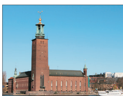
「諾貝爾獎頒獎場地」 市政廳

宮內有七個公園，二十個大小皇宮，其中一個為夏宮，宮內之廳房布置，金碧輝煌，艷麗奪目，並可看到珍貴之油畫、瓷器及家具等。夏宮前之御花園，設計別具心思。