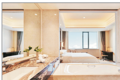
永泰喜來登酒店客房