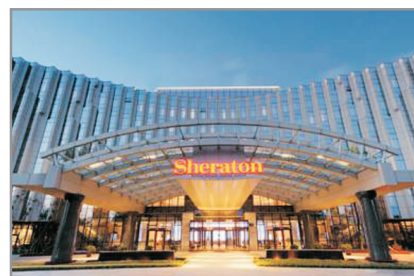
長春淨月潭益田喜來登酒店