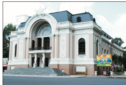
法國風情的市立歌劇院

古芝地道、戰爭博物館、湄公河三角洲、熱帶水果園、耶穌山、鯨魚廟、Vincom Center、歷史博物館、3D視覺美術館