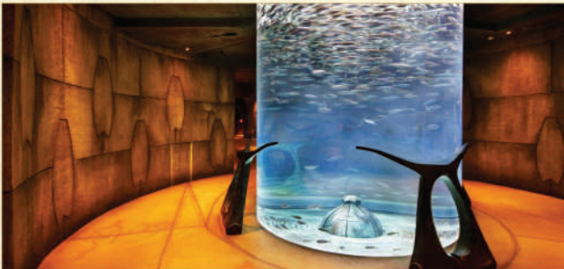
▲ Lost Chambers海底世界

• Lost Chambers海底世界 ：容量1100萬公升的水族館，更可以看見魚群暢游，且有魔鬼魚及鯨鯊在潛水員身邊游過的驚險場面吸引遊客。想發掘沉睡海底數千年的亞特蘭提斯神秘遺跡，還可以穿越大使湖湖下的迷宮一般的海底隧道。本社安排昂貴入場門票，讓你透過玻璃通道近距離觀賞65,000隻海洋生物。