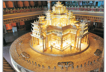
香巴拉藏文化博物館

# 因應內陸航班之機位分配，或有可能改為第5天早上從中甸飛往昆明，行程住宿則改為連續2晚入住香格里拉酒店，並減少一晚昆明住宿，有關之安排將於出發前由領隊通知作實。