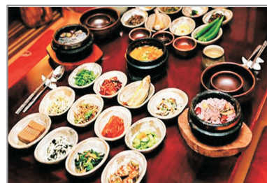
景福宮正宗韓國料理+烤肉