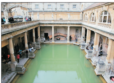
「體驗浴場文化」 古羅馬浴場博物館