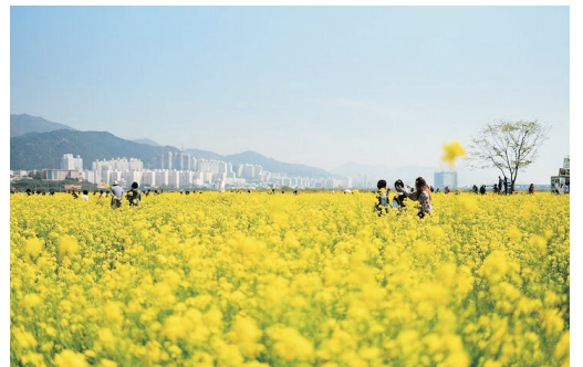
《增遊》大渚生態公園(賞油菜花註1) (3月28日至4月25日出發團隊適用)