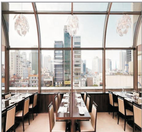
Lotte Hotel Busan~La Seine