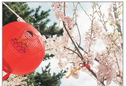
海東龍宮寺(賞櫻花註1)