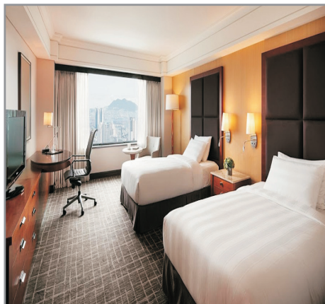
Lotte Hotel Busan客房