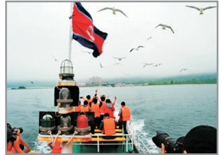
乘船出海觀賞野生海狗