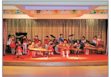
青少年及兒童表演

*【客人專享無限次室內外泡池, VIP專屬更衣區、養生茶。】至6月15日前入住適用。