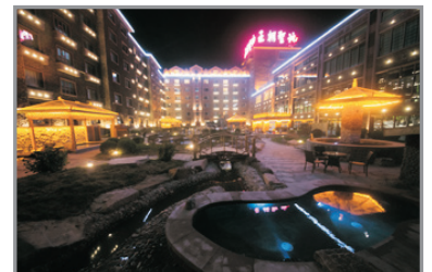
王朝聖地溫泉度假酒店