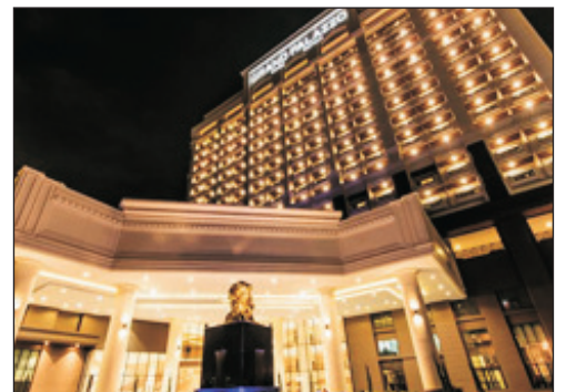
Grand Palazzo Hotel Pattaya