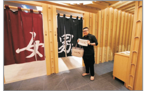
Grande Centre Point~ Sukhumvit 55