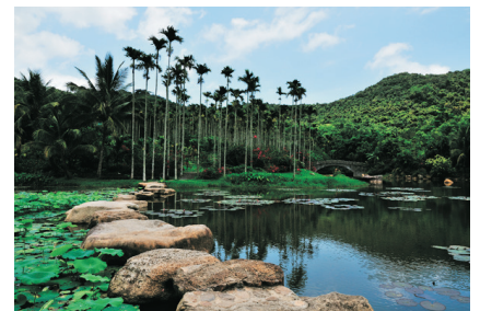
呀諾達熱帶雨林文化園

第3天 中國鑽石級雨林景區、國家5A級旅遊景區~呀諾達熱帶雨林文化園(參觀果園及品嚐水果)*(包雨林穿梭巴士)—水稻國家公園(中國首個水稻文化科普博覽體驗基地及世界首個1:1 恐龍科普博覽基地)(包入場門票及电瓶车)—三亞 *果園內的水果只能於園內享用，將不能帶出園區，敬請留意。