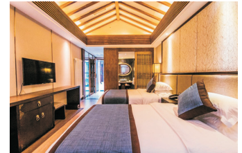
樂山禪驛度假酒店