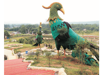
都江堰玫瑰花溪谷

重慶路油菜花田： 重慶路全長42公里，這條公路以春天的花海聞名，素有「中國最美鄉村公路」之稱。道路兩旁的油菜花漫山遍野，一望無垠，美不勝收。