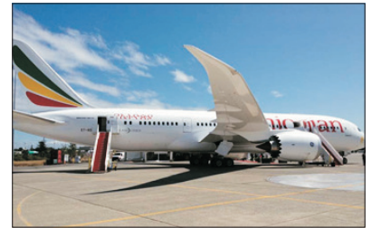
埃塞俄比亞航空—B787客機